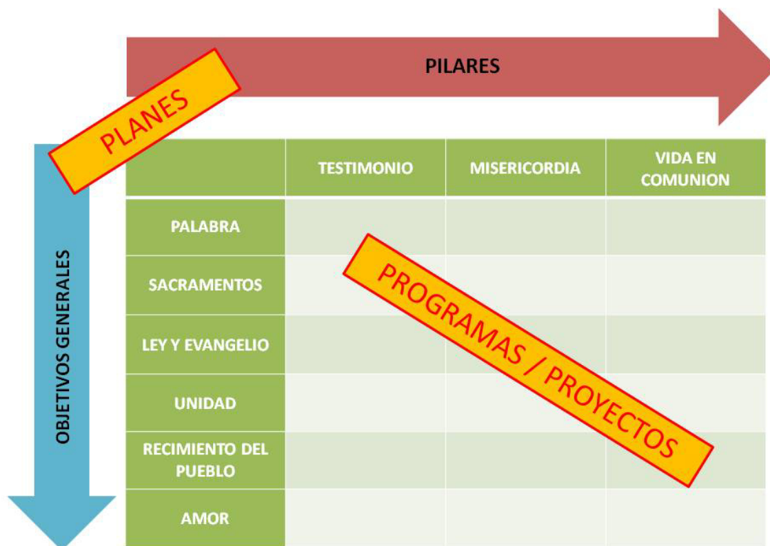
FIGURA 2 MATRIZ ESTRATÉGICA GENERAL

La figura siguiente muestra la matriz de base, la cual se utilizará como estrategia general para la formulación de los Planes, Programas y Proyectos específicos, en función del diagnóstico de la realidad actual.