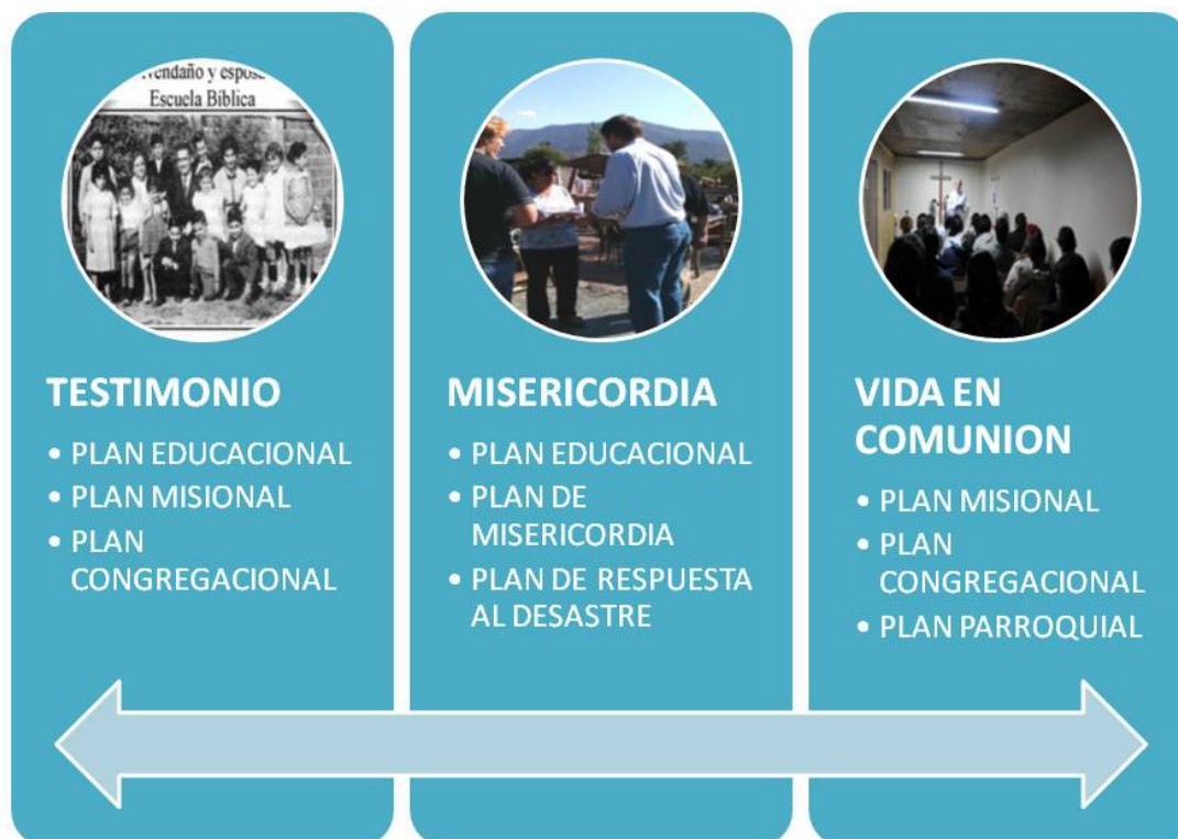
FIGURA 3 RELACIÓN ENTRE PILARES Y PLANES